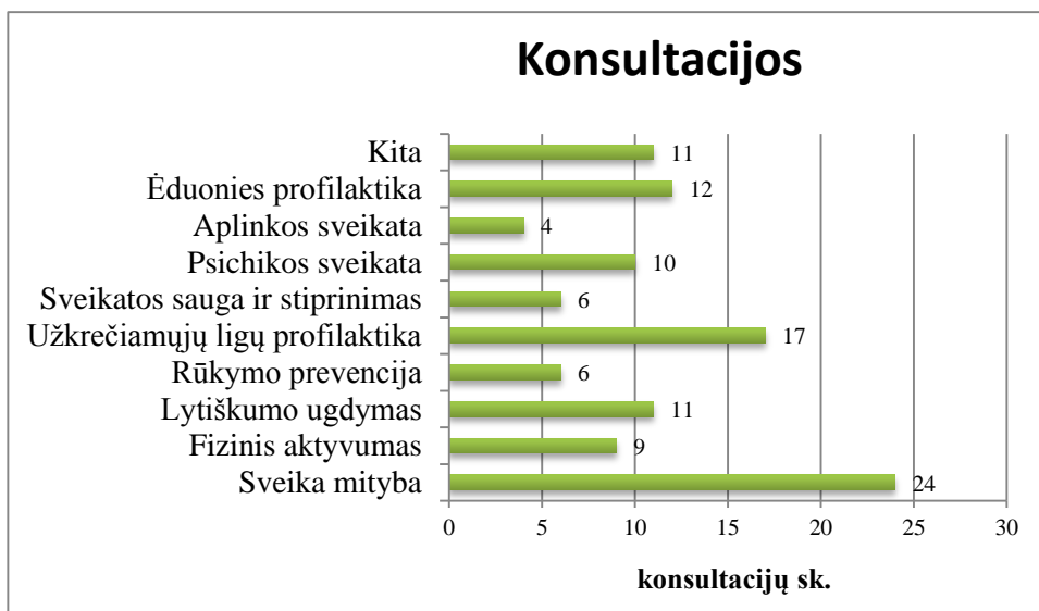
2 pav. Suteiktų konsultacijų tematika (2018 m.)

Daugiausia konsultacijų suteikta sveikos mitybos, užkrečiamųjų ligų profilaktikos, ėduonies profilaktikos, lytiškumo ugdymo, psichikos sveikatos ir kitais klausimais (žr. 2 pav.).