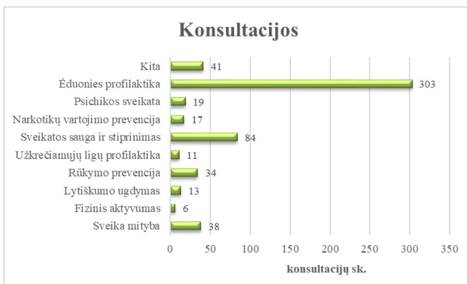
2 pav. Suteiktų konsultacijų tematika (2022 m.)

2022 m. daugiausia konsultacijų suteikta dantų ėduonies profilaktikos tema, net 303 individualios konsultacijos. Taip pat buvo konsultuota sveikatos saugos ir stiprinimo, sveikos mitybos, rūkymo prevencijos, psichikos sveikatos, užkrečiamųjų ligų profilaktikos, narkotikų vartojimo prevencijos, lytiškumo ugdymo, fizinio aktyvumo ir kitais klausimais (žr. 2 pav.).